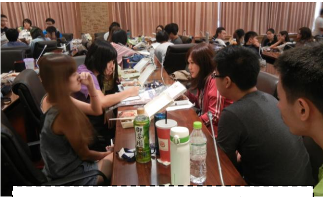
分組學生利用午休時間討論成果簡報內容