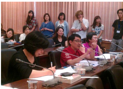
透過資深業界評審群認真地給予學生講評，讓學生獲益良多!!