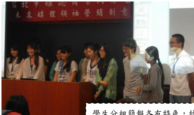
學生分組簡報各有特色，結果令人驚艷！